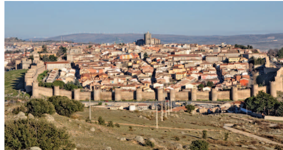
Fig. 1.—La ciudad de Ávila desde el oeste.

Hoy sabemos que el origen de Ávila se remonta a la segunda mitad del siglo I a.C. Desocupados los castros vettones de Las Cogotas (Cardeñosa) a 10 Km., de Ulaca (Solosancho) a 22 Km. y de La Mesa de Miranda (Chamartín) a 25 Km., posiblemente como consecuencia del fin de la segunda guerra civil romana que enfrentó a Pompeyo y a César, aparecerá Obiba en un lugar intermedio entre todos