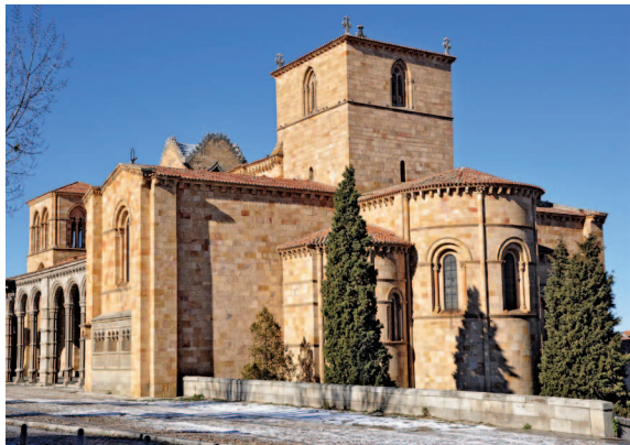
Fig. 3.—Basílica románica de San Vicente.