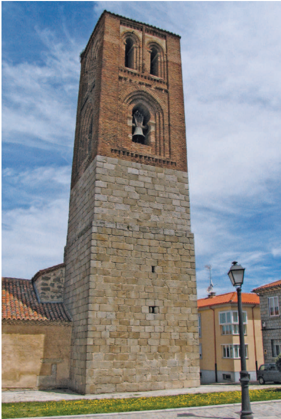
Fig. 6a.—Torre mudéjar de la iglesia de San Martín.