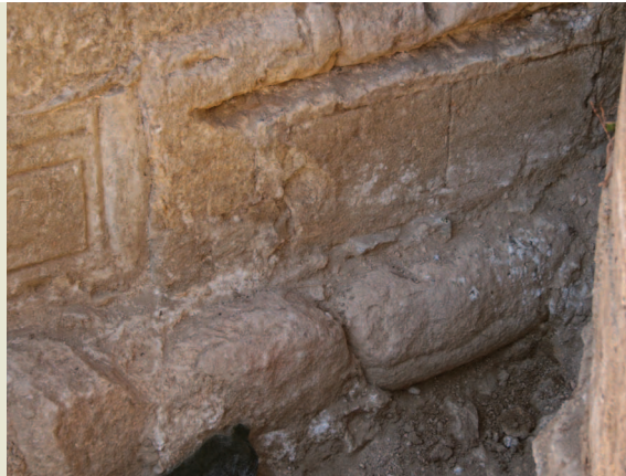
Fig. 7b.—Cupa o fragmento de escultura zoomorfa en el cimcio del ábside de San Andrés.

San Pelayo) y en otros de tumbas de incineración asociadas a templos. Por alguna razón en determinados lugares de culto romanos de Ávila y sus inmediaciones, además de todo lo significativo que contenía un templo, había alguna tumba de incineración tallada en dos bloques de piedra, en el que en uno se depositaban las cenizas en una especie de caja excavada en el bloque, colocándose sobre ella para protegerlas otro bloque. Esto se ha constatado en la Obila romana y también en sus inmediaciones, por ejemplo en la iglesia mudéjar de la Asunción de Narros del Puerto, donde junto a las aras había también alguna cista y su cupa correspondiente, contenedores de las cenizas de un difunto del siglo I-II con alguna categoría.