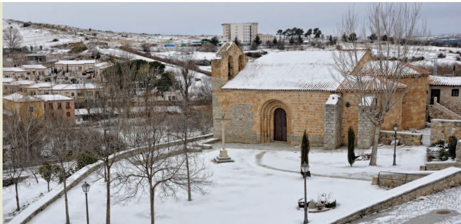
Iglesia de San Segundo (antigua San Sebastián).