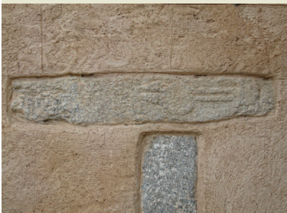
Fig. 6b.—Ara romana embutida en la fachada sur de la iglesia de San Martín.

cias, mostrando la evolución del factor religioso en el contexto de la ciudad antigua. Hablaremos aquí precisamente de la permanencia de cultos distintos sobre los mismos lugares, enlazando lo pagano con el románico a través de la ocupación de los mismos puntos, símbolo de la evolución de las creencias.