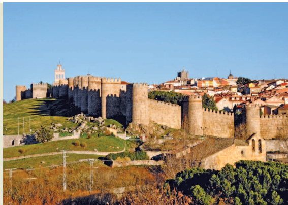
Fig. 4.—Iglesia románica de San Segundo (antes San Sebastián) extramuros y en la inmediatez al río.

ellos, sobre una elevación menos notoria al lado del río Adaja que la que mostraban los castros pre-romanos. Lo que en un primer momento debió ser un enclave elemental destinado a establecer de una manera organizada la presencia romana dentro de una zona conquistado, se convierte en los siglos I y II en un punto de referencia territorial. Si bien nunca fue una ciudad de la importancia de tantas otras en la Hispania Alto Imperial, hubo de ser un centro administrativo y también religioso con el fin de organizar la vida de un determinado territorio, puesto que muy tempranamente ya fue sede episcopal.