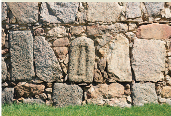
Toro de piedra embutido en el cubo 43 de la muralla de Ávila presuntamente procedente de las inmediaciones de San Segundo.