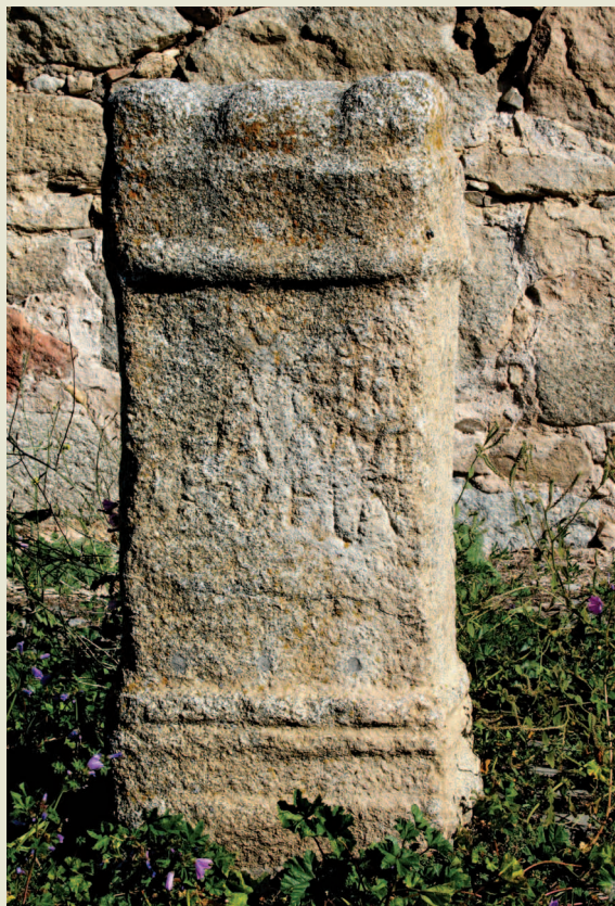
Ara romana hallada en la escalinata oeste de la iglesia.