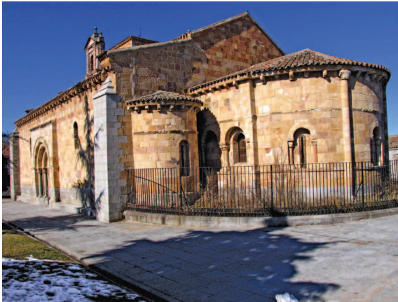
Fig. 7a.—Iglesia románica de San Andrés.