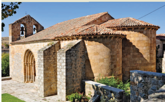
Iglesia de San Segundo.